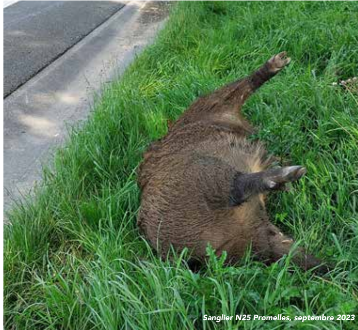
Sanglier N25 Promelles, septembre 2023

Le sanglier est un animal sauvage, de plus en plus présent au nord du sillon Sambre et Meuse qui n'est pas son territoire naturel et qui peut causer des dommages importants aux cultures (maïs, froment, pomme de terre ...), aux jardins, aux plantes et aux infrastructures (terrain de golf, piste d'ULM ...).