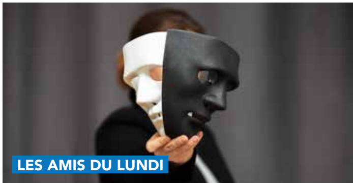
LES AMIS DU LUNDI