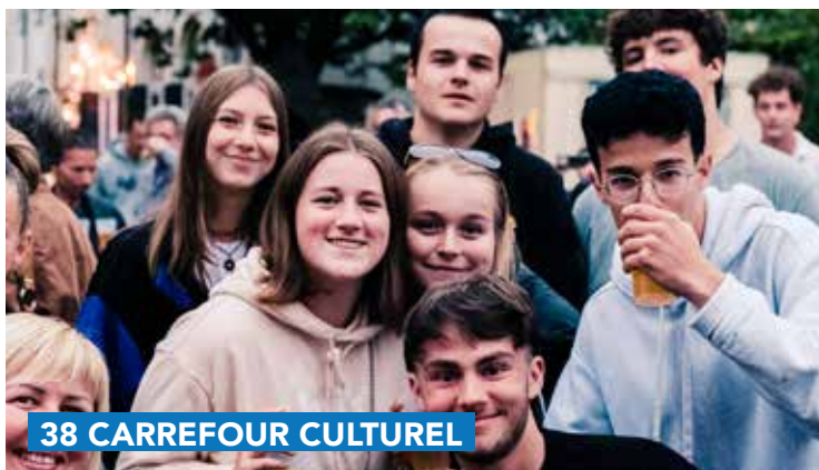
38 CARREFOUR CULTUREL

Journée « Genappe autour du monde » Dimanche 19 mars 2023 Au 38, de 10h à 22h. Gratuit.