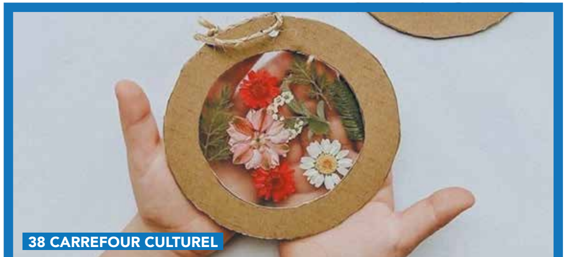
38 CARREFOUR CULTUREL

Conférence "Que veulent nous dire les jeunes ?" Le jeudi 16 mars 2023 Au 38, à 20h. Gratuit. Toutes les inscriptions se font en ligne via www.le38.be / agenda