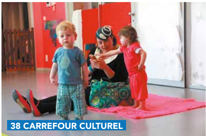
38 CARREFOUR CULTUREL