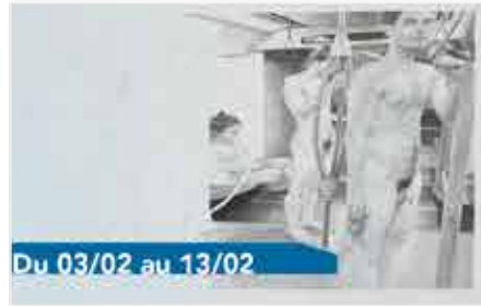
Du 03/02 au 13/02

Des rencontres pour les personnes âgées désireuses d'en savoir un peu plus sur les trucs et astuces de la technologie... Une fois par mois au 38. RDV sur www.le38.be pour découvrir les dates. Gratuit. Sur réservation.