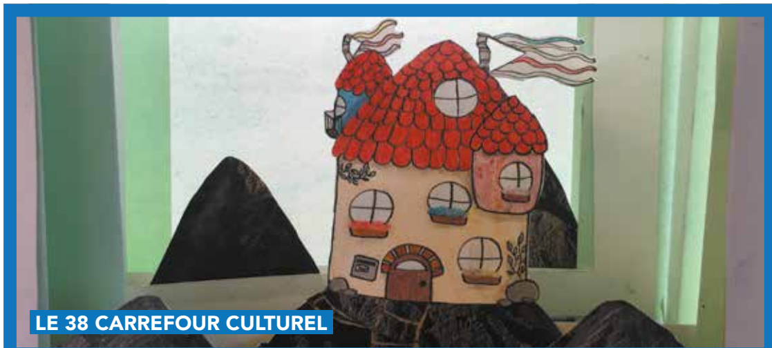
LE 38 CARREFOUR CULTUREL