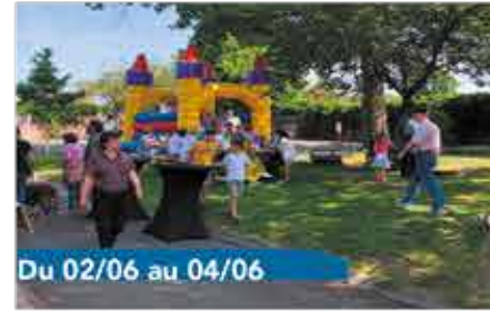
Du 02/06 au 04/06

Spectacle, vide dressing, documentaire, ateliers... pendant 10 jours, nous mettrons le focus sur les dérives de la fast fashion, tout en mettant en avant des alternatives pour s'habiller de manière plus respectueuse de l'environnement. Détails à suivre.