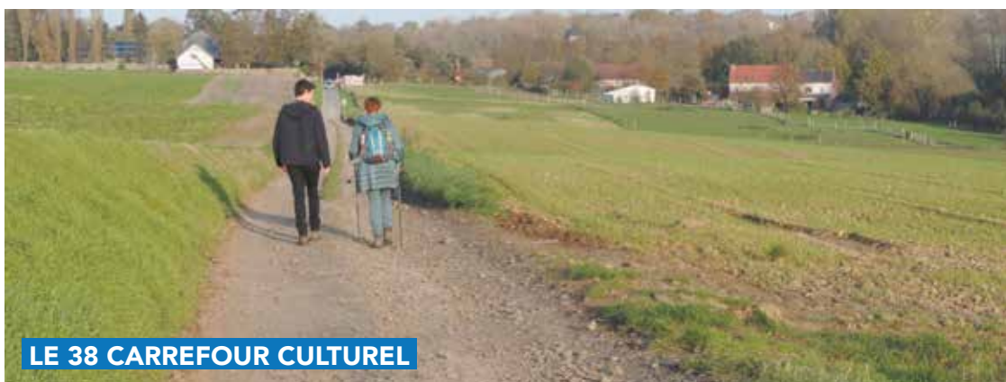
LE 38 CARREFOUR CULTUREL

Retrouvez l'offre sur www.le38.be , ainsi que le programme des stages de Carnaval et de printemps. Nouveau : les inscriptions se font en ligne, sur www.le38.be , rubrique agenda !