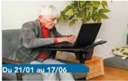
Du 21/01 au 17/06

plus économique pour nos portefeuilles... Bonne découverte ! PETIT RAPPEL : dorénavant, toutes les réservations à nos activités se font en ligne via www.le38.be (rubrique agenda).