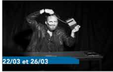
22/03 et 26/03

En mars, le 38 ouvrira à nouveau grand ses portes aux Genappiens, afin d'éveiller leurs sens à d'autres cultures et au monde. Une journée dédiée à la rencontre de l'autre. Programme complet à suivre. Gratuit !