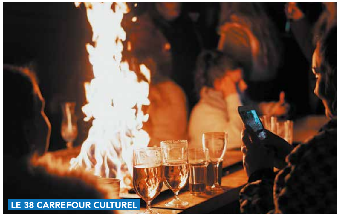
LE 38 CARREFOUR CULTUREL

Le 2 février 2023 au MONTY À 20h – 5 € Réservation indispensable sur www.le38.be , rubrique agenda.