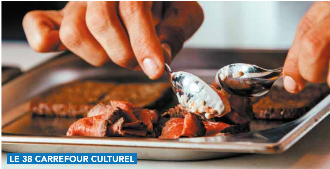
LE 38 CARREFOUR CULTUREL