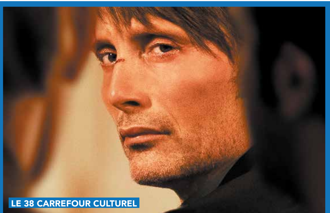
LE 38 CARREFOUR CULTUREL