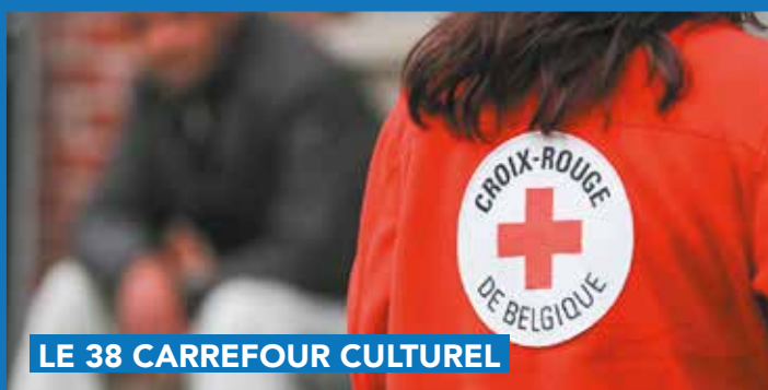
LE 38 CARREFOUR CULTUREL

Damien est là pour y répondre au 067/77.16.27 ou à damien@le38.be