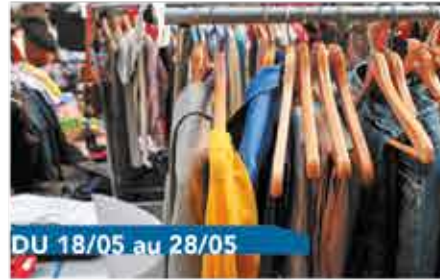
DU 18/05 au 28/05

Des pavés, de la forêt, un vignoble et de magnifiques fermes brabançonnaises, voilà autant de choses que l'on vous fera le plaisir de (re)découvrir ! Rendez-vous sur la place communale à Bousval. 5€/adulte, 3€/enfant. De 10h à 11h30. Sur réservation.