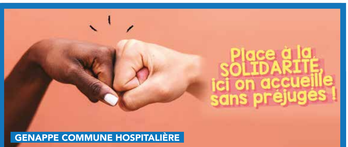
GENAPPE COMMUNE HOSPITALIÈRE