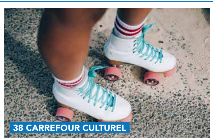
38 CARREFOUR CULTUREL