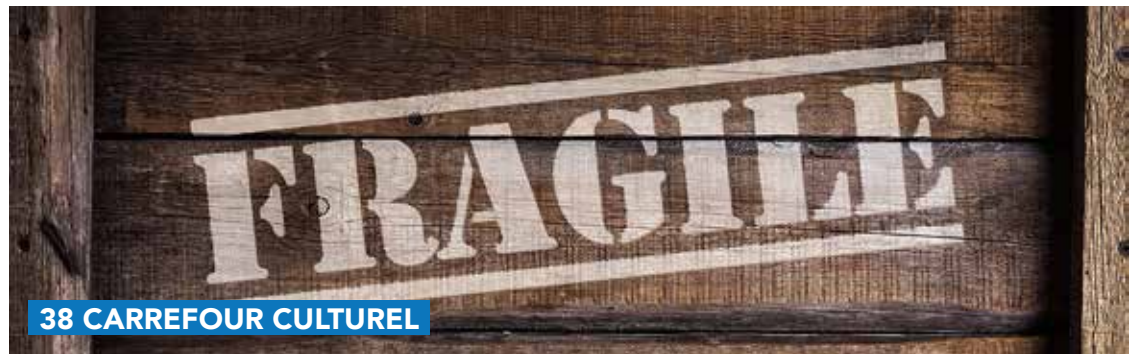
38 CARREFOUR CULTUREL

Exposition à la Maison Galilée - Plaine communale 2, 1470 Genappe. Vernissage le 20 octobre 2023 de 18 h à 20 h Samedi 21 octobre de 14 h à 18 h Dimanche 22 octobre de 13 h à 18 h