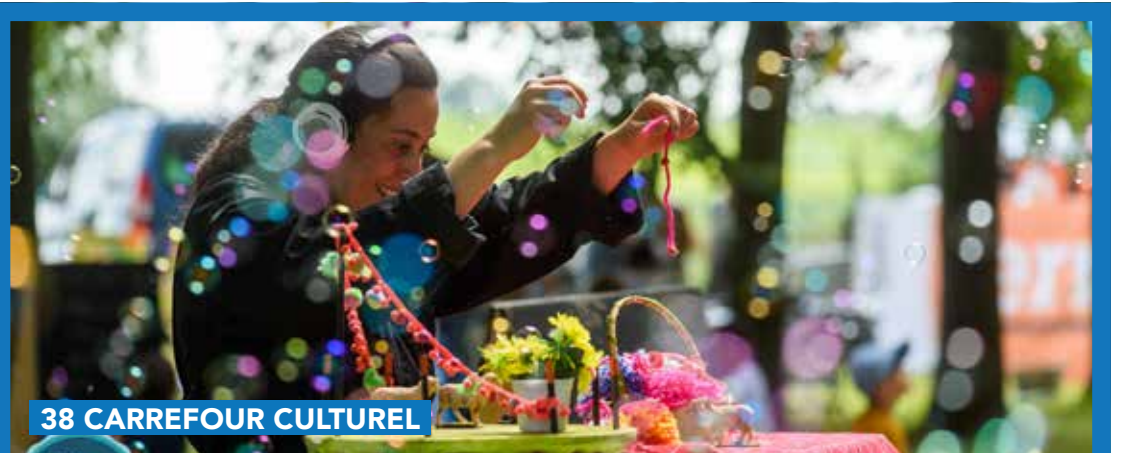
38 CARREFOUR CULTUREL

Rendez-vous le jeudi 12 octobre à 19h30 à la bibliothèque. N'oubliez pas de réserver votre place au 067/79.42.92 ou bibliotheque@genappe.be (ou via la page Facebook). Bibliothèque de Genappe Espace 2000, 16 -1470 Genappe