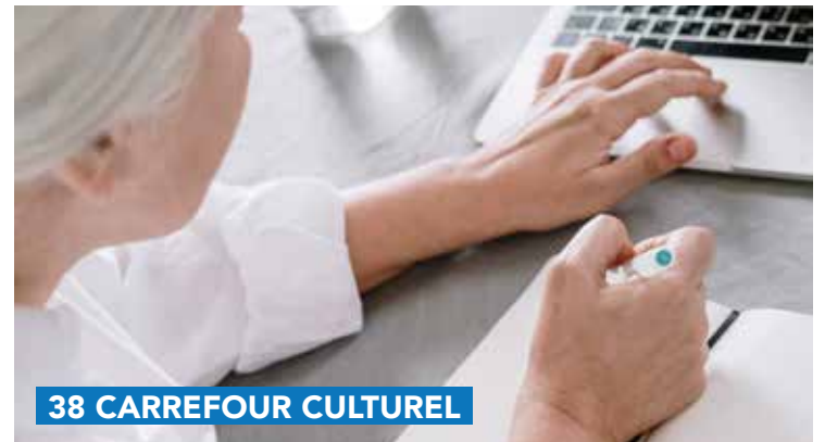
38 CARREFOUR CULTUREL

De 14h à 18h30 dans le jardin du 38. Gratuit. Sans réservation.