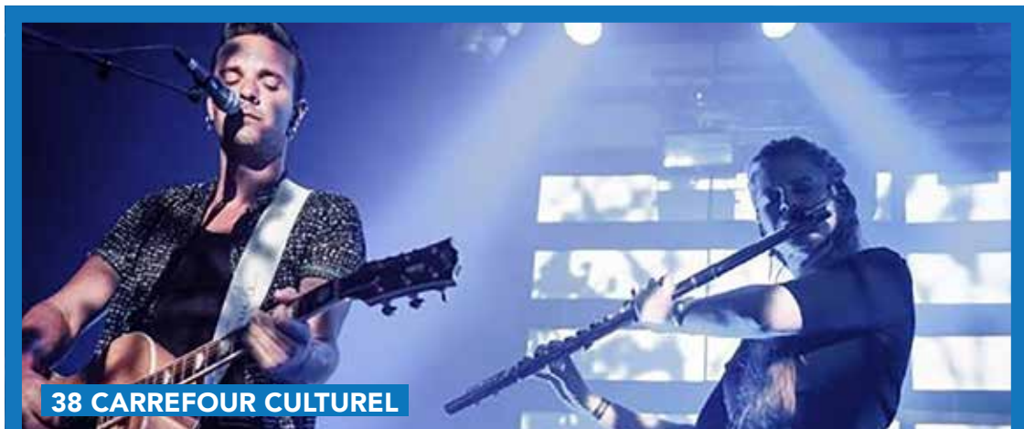
38 CARREFOUR CULTUREL

Le 23/09 de 13h à 18h. Départ des festivités dans le jardin du 38. Gratuit. Sans réservation. En partenariat avec la Ville de Genappe et Sport Communication.