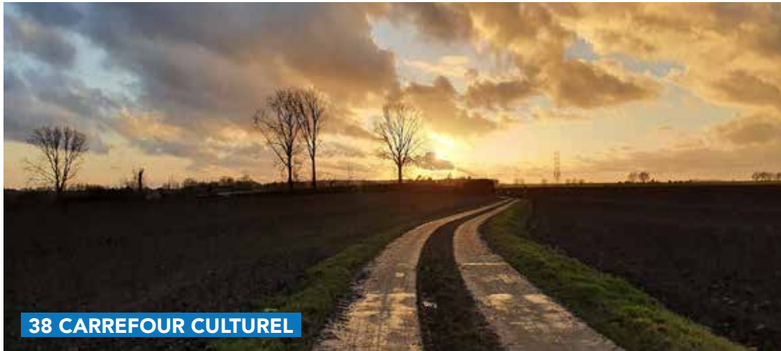
38 CARREFOUR CULTUREL