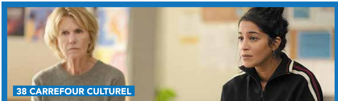
38 CARREFOUR CULTUREL

Informations : Projection « Elle était gentille et n'a jamais eu d'enfants » de Cécile Voglaire - 2023 Le 19 janvier 2024, à 20h au 38 - 3€. Réservation indispensable sur www.le38.be/agenda .