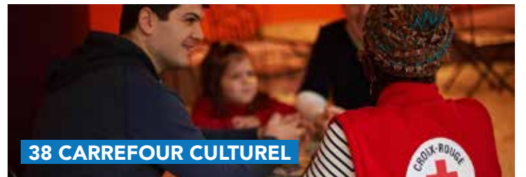
38 CARREFOUR CULTUREL

Informations et inscriptions sur www.le38.be/Léz'Arts/stages .