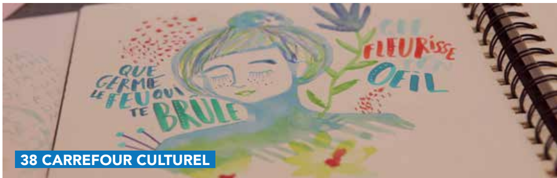
38 CARREFOUR CULTUREL