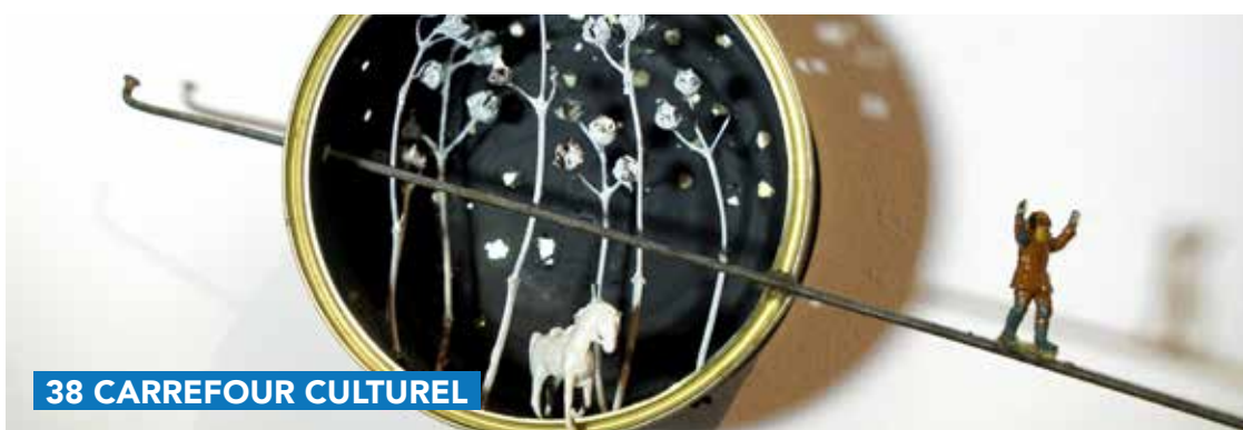
38 CARREFOUR CULTUREL

Informations : Projection de « Je verrai toujours vos visages », de Jeanne Herry - 2023. Dans le cadre du Ciné-club citoyen. Le 11 janvier 2024, à 20h au Monty - 5€. Réservation indispensable sur www.le38.be/agenda .