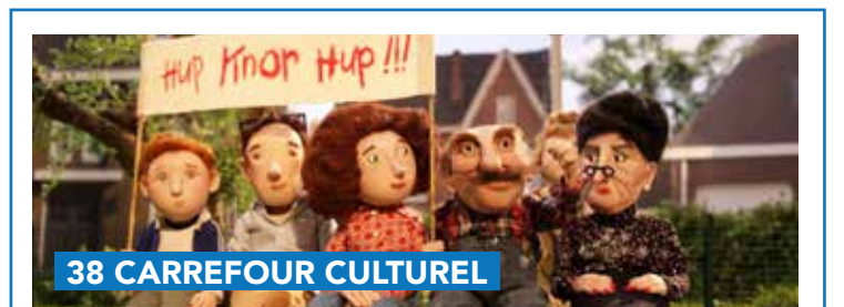
38 CARREFOUR CULTUREL

Informations : Conférence : Le centre Croix-Rouge, un an après Le 29 janvier 2024, à 18h30 à la salle du conseil communal de la Ville de Genappe - gratuit. Réservation indispensable sur www.le38.be/agenda .