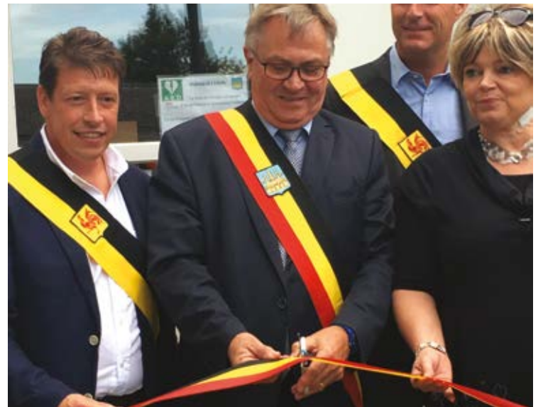
A l'occasion du 25 e anniversaire de l'implantation de Genappe, les autorités communales viennent de procéder à la réouverture de l'académie après des travaux de rafraîchissement et de rénovation financés à hauteur de 50.000€

067/79.42.96, les lundi, mardi, jeudi et vendredi de 15h à 18h, le mercredi de 12h à 18h, hors congés scolaires.