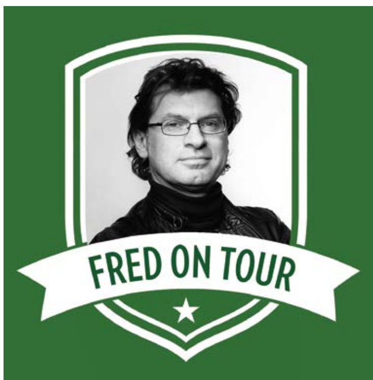
Le best of des chroniques de Frédéric Waseige

Les taxis Claude et L. Francet Voitures - Minibus - Autocars +32(0)10/41.58.58 +32(0)475/82.11.69 contact@taxisclaude.be