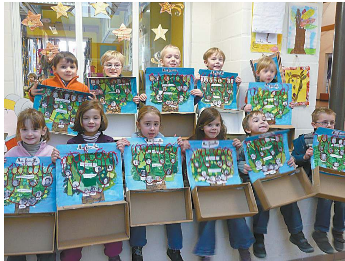
Nos arbres généalogiques