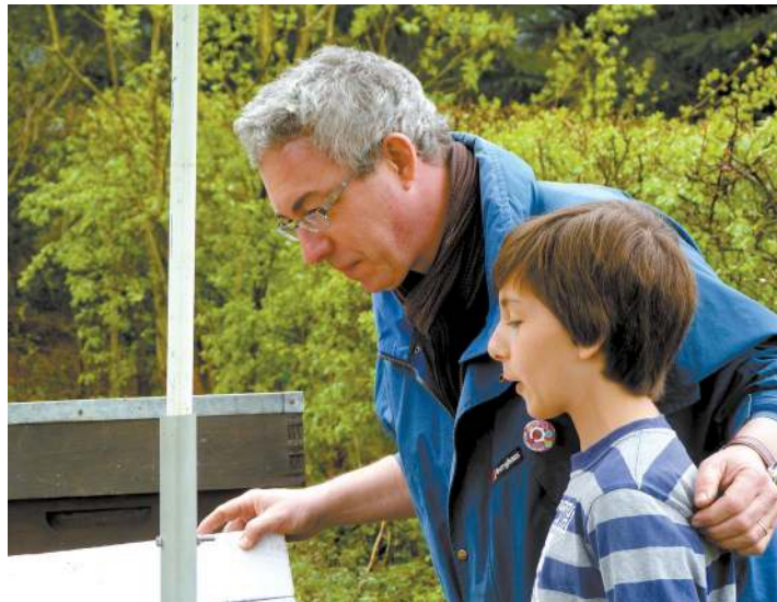
L'apiculteur passeur de savoir

Le Collège communal vous invite à faire la fête, dimanche 29 avril de 8h à 17h!